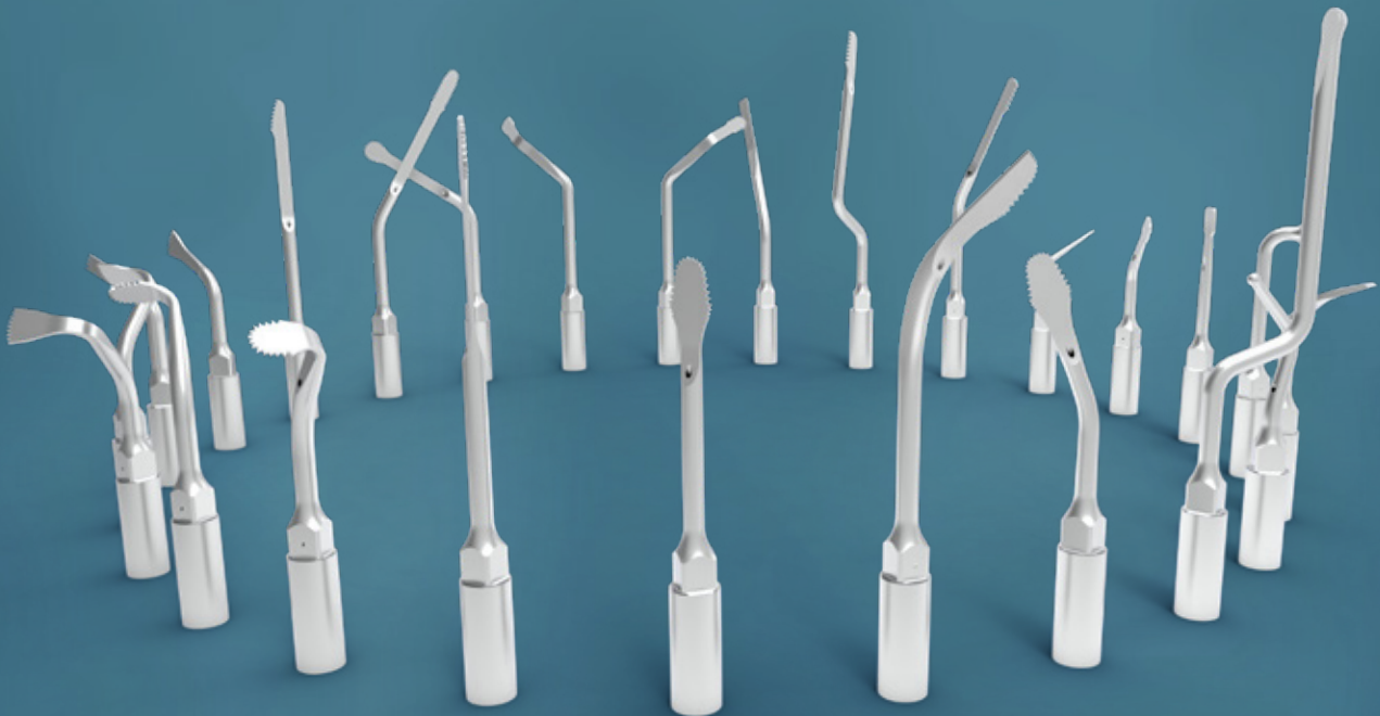
Abb. Symbolfotos. Zusatzausstattung und Inhalt der gezeigten Zubehörteile sind nicht im Lieferumfang enthalten.