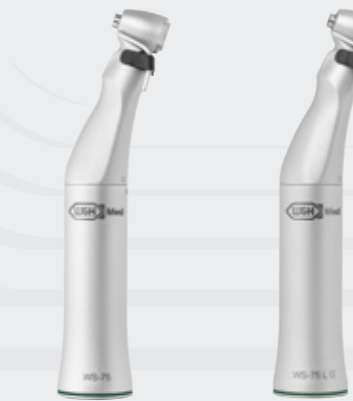
WS-75 20:1, démontable

Tous les instruments sont démontables, thermodésinfectables et stérilisables afin de respecter les exigences élevées en matière d'hygiène.