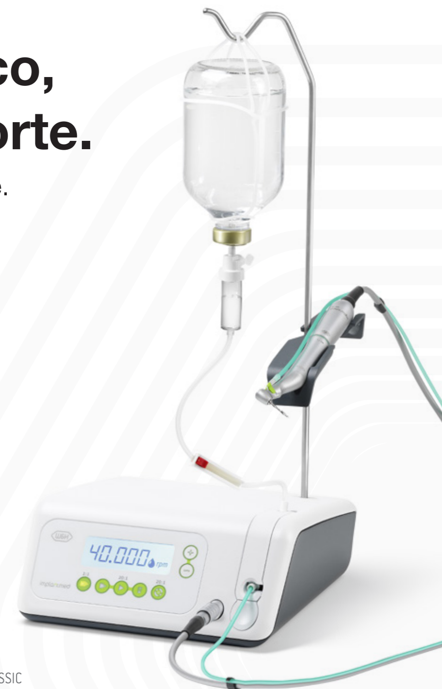
Fig. Fotos de símbolos. Equipamento adicional e conteúdo dos acessórios apresentados não estão contidos no material fornecido.

Fornece o que promete. Agora e no futuro.